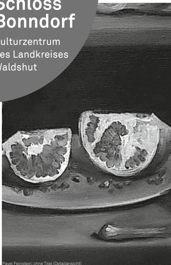
Pavel Feinsein: ohne Titel (Detailansicht)