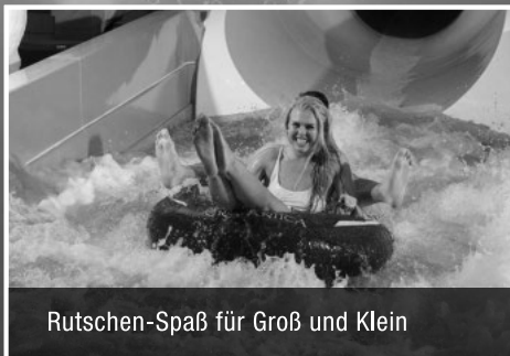
Rutschen-Spaß für Groß und Klein