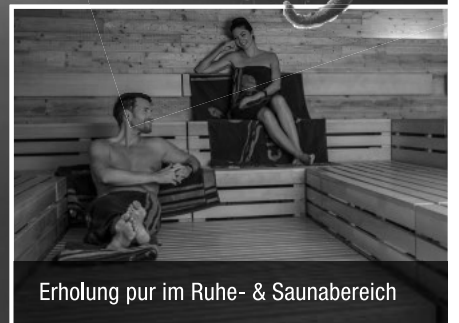
Erholung pur im Ruhe- & Saunabereich