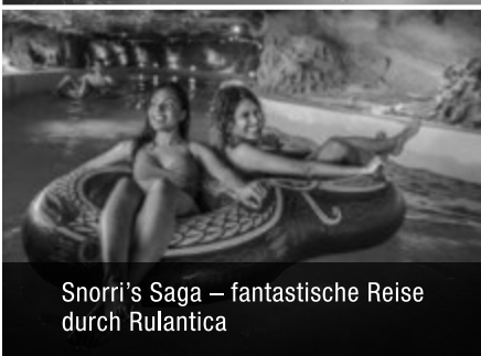
Snorri's Saga – fantastische Reise durch Rulantica