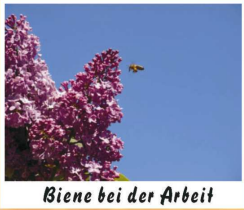
Biene bei der Arbeit